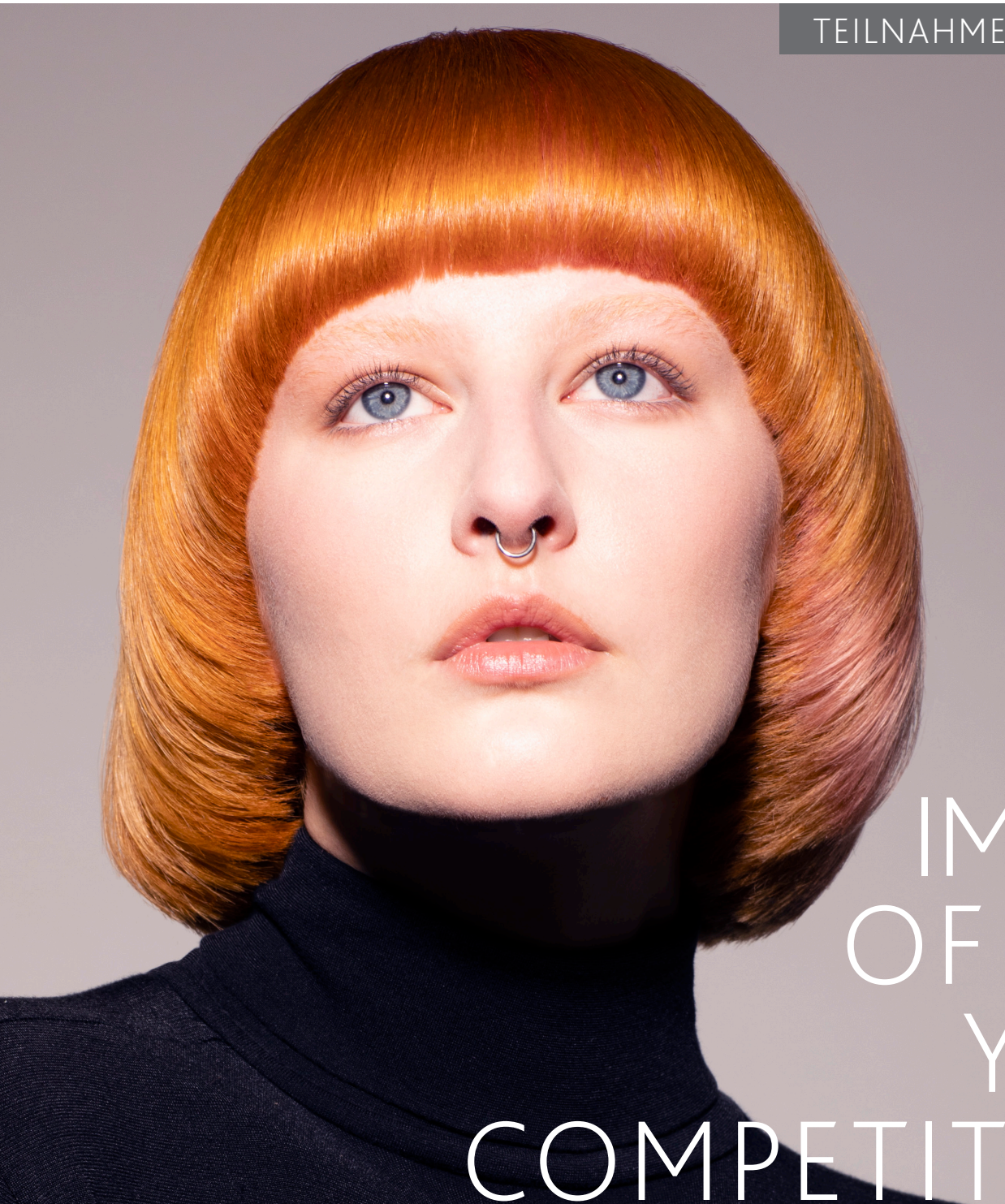
IMAGE OF THE YEAR COMPETITION 2022